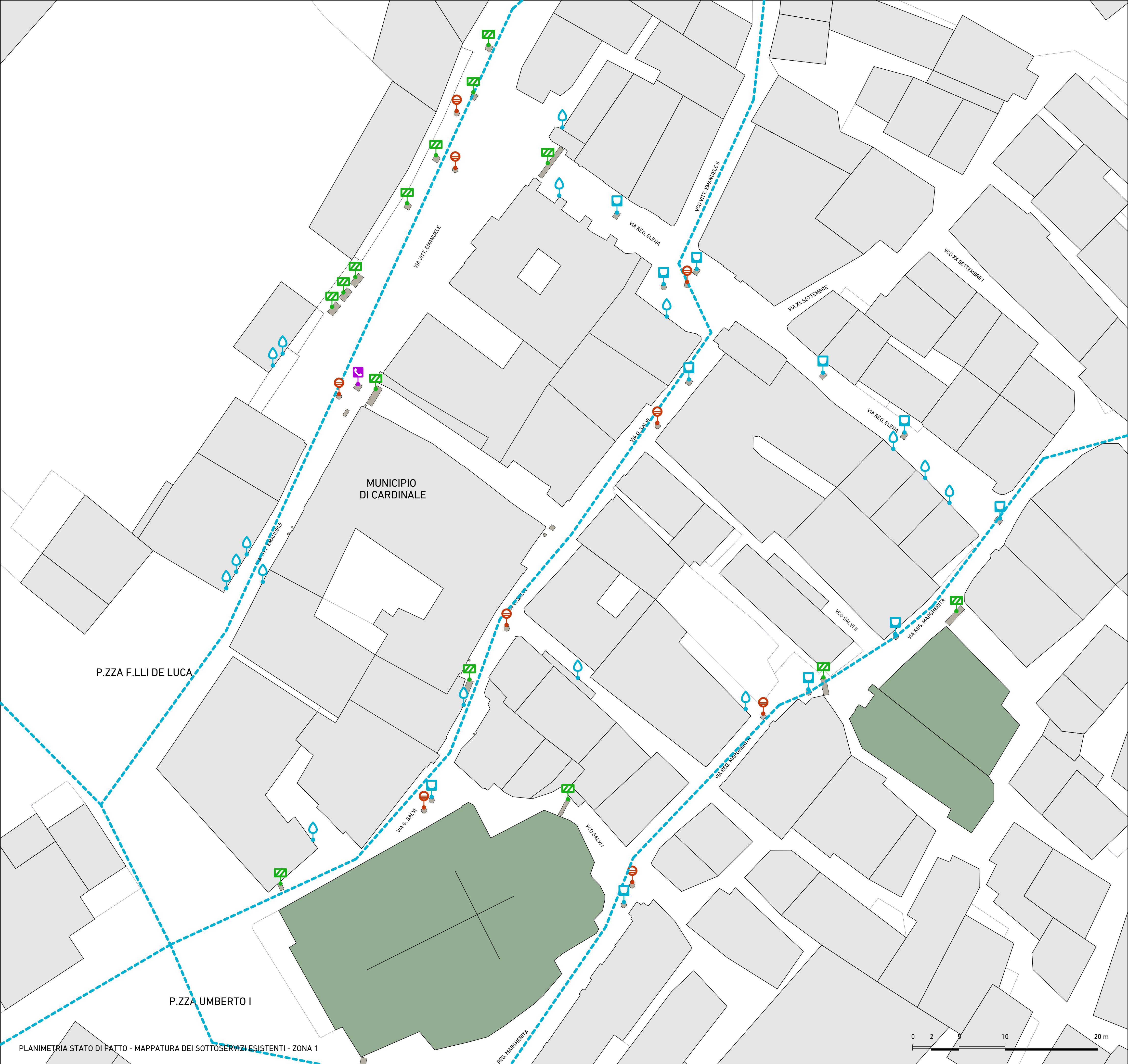
STRALCIO ZONA 1